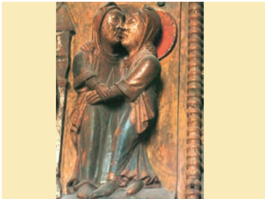
Heimsuchung, Holztür, St. Maria im Kapitol, Köln, um 1065; Foto: Oswald Kettenberger; © ars liturgica Buch- & Kunstverlag MARIA LAACH, Nr. 5920; www.maria-laach.de/verlag

Die Begegnung der beiden Frauen Maria und Elisabeth ist liebevoll und voll Freude im Hl. Geist. Sie freuen sich nicht nur über das je eigene Geschenk, sondern ebenso – ja sogar noch mehr – über das auch der anderen Geschenke. Genau das ist es, was der Kirche heute in so vielen Bereichen Not tut: Die Freude an dem, was (auch) des anderen ist. Das gemeinsame Priestertum aller Getauften und das Priestertum des Dienstes stehen nicht als Konkurrenz gegeneinander, sondern sind aufeinander verwiesen und bereichern einander.